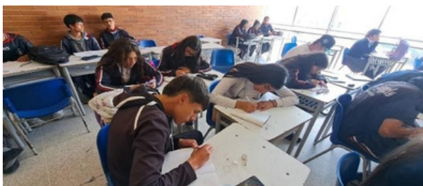
Figura 2. Jornada Académica en IED. Trabajo Propio

La innovación y la creatividad son pilares fundamentales en la enseñanza de la actualidad. Los avances tecnológicos, la globalización y los cambios sociales exigen que los docentes sean capaces de pensar de manera innovadora, adaptando sus métodos pedagógicos a las nuevas necesidades y desafíos. En el contexto de la Licenciatura en Educación Mención Orientación, la creatividad se utiliza como una herramienta para generar espacios de aprendizaje dinámicos y flexibles, que favorezcan tanto el desarrollo intelectual como emocional de los estudiantes.