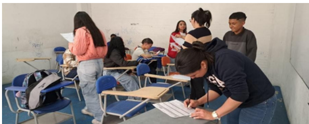
Figura 3. Entrega de Informes. Trabajo Propio

Las metodologías activas, como el aprendizaje basado en proyectos, el aprendizaje colaborativo y el uso de tecnologías digitales, permiten que los estudiantes se involucren de manera activa en su proceso educativo. En este sentido, el profesional en orientación educativa juega un papel esencial en el diseño, acompañamiento y evaluación de experiencias pedagógicas innovadoras permitiéndole identificar las necesidades individuales y grupales de los estudiantes, promoviendo intervenciones oportunas que favorezcan su desarrollo integral. En el contexto del aula, el orientador es capaz de implementar talleres vivenciales, de resolución de conflictos, simulaciones, dinámicas grupales y proyectos interdisciplinarios que conecten los contenidos académicos con los intereses y las experiencias de vida. Estos espacios potencian el aprendizaje, la autorreflexión, el autoconocimiento y la gestión emocional.