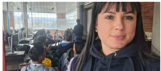
Figura 1. Jornada de Bienestar. Trabajo Propio

Este artículo explora cómo, desde esta profesión es posible educar con una visión integral, fomentando la autonomía, el crecimiento personal y el desarrollo integral de los estudiantes, no solo desde el aspecto cognitivo, sino también desde el emocional y social.