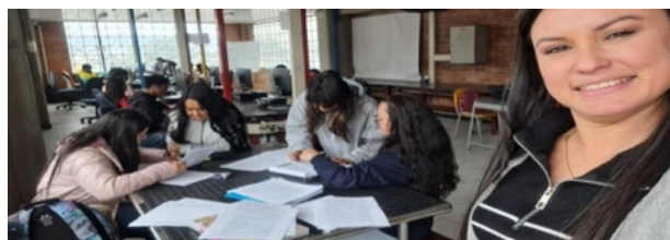
Figura 4. Jornada de Seguimiento al Plan de Trabajo. Trabajo Propio

Un aspecto crucial de la innovación educativa desde la orientación es su compromiso con la inclusión social y el respeto a la diversidad. Los profesionales en orientación, al ser formados bajo principios de justicia social y equidad promueven espacios en los que todos los estudiantes, independientemente de su contexto cultural, social o económico tengan la oportunidad de desarrollarse de manera plena. Este enfoque contribuye a la creación de una ciudadanía crítica y responsable, capaz de enfrentar los desafíos de una sociedad cada vez más plural y diversa.